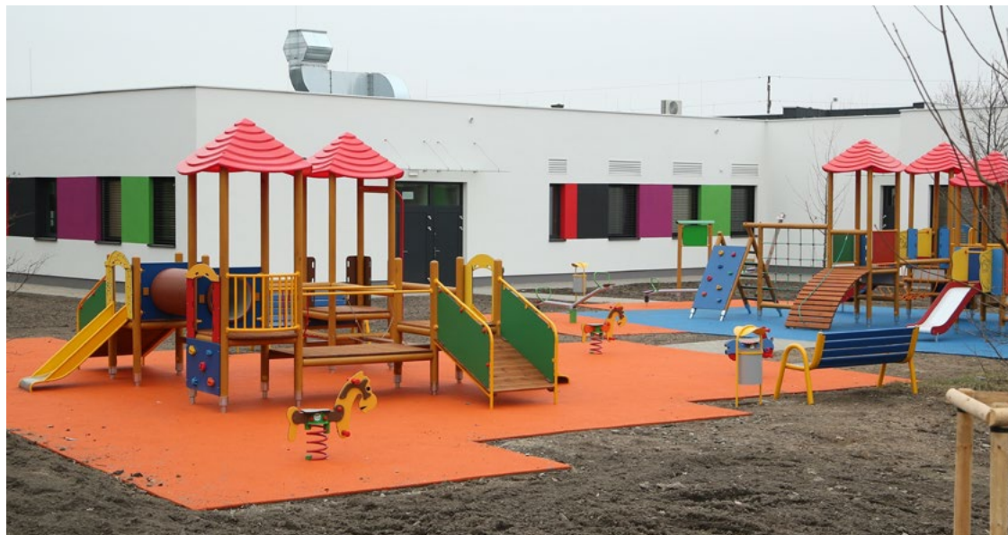
Przedszkole przy ul. Dębickiej 31 to inwestycja za około 9 milionów złotych