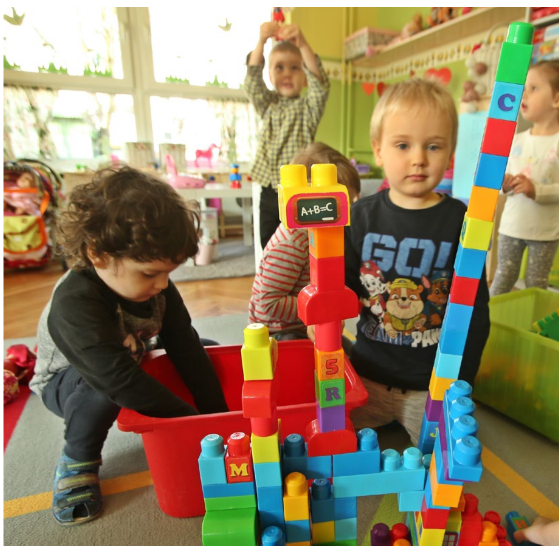
Grupa „Obłoczki” z Przedszkola nr 41 im. Jana Pawła II przy ulicy Dobrej 16 we Wrocławiu

Wszystkie dzieci mają zapewnić miejsce w szkole obwodowej – zgodnie ze swoim miejscem zamieszkania – i przyjmowane są do niej na podstawie zgłoszenia, które jest też oświadczeniem woli nauki w danej szkole. Dlatego, jeśli chcemy wprowadzić zgłoszenie w elektronicznym systemie rekrutacji,