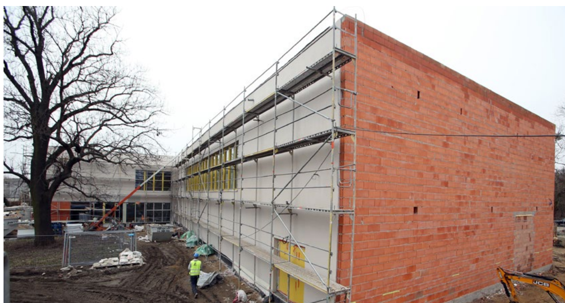
Dobudowany segment będzie skomunikowany łącznikiem z budynkiem istniejącym szkoły. Koszt rozbudowy Zespołu Szkolno-Przedszkolnego nr 5, ul. Osobowicka 127 to ok. 22 mln złotych